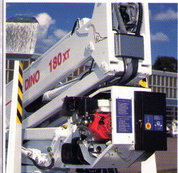
Optionaler HONDA-Benzinmotor zum netzunabhängigen Betrieb.