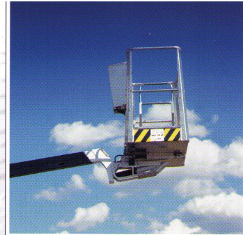
Schwenkbarer Arbeitskorb für exakte Arbeitsposition.