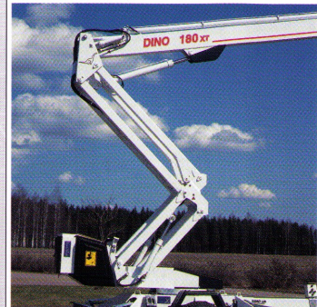
Überfahren verschiedener Hindernisse bis 2.5 m durch vertikal bedienbares Scherengelenk.