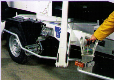
Der Fahrtrieb lässt sich bedienerfreundlich steuern.