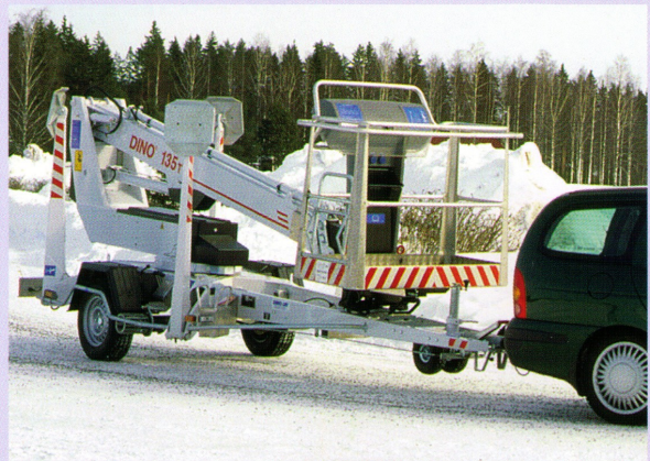
Mühele Transportierbarkeit ist bei DINO ein Begriff.

DINO® und Dino Lift® sind von Dino Lift Oy registrierte Handelsmarken.