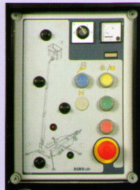
Die Steuerzentrale ist übersichtlich.